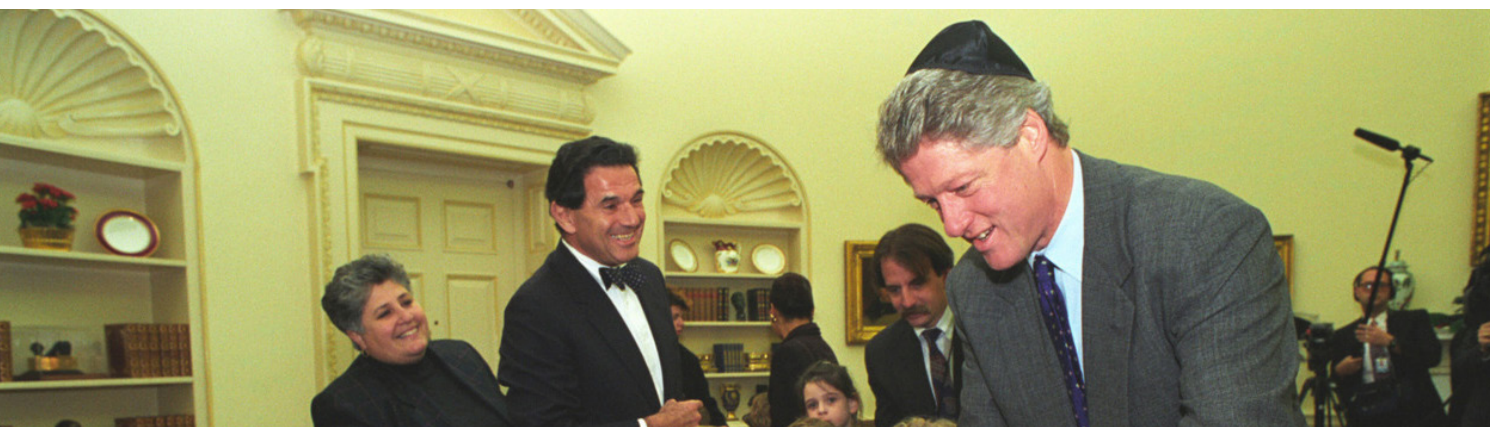
Clinton celebrando el Janucá en el despacho Oval