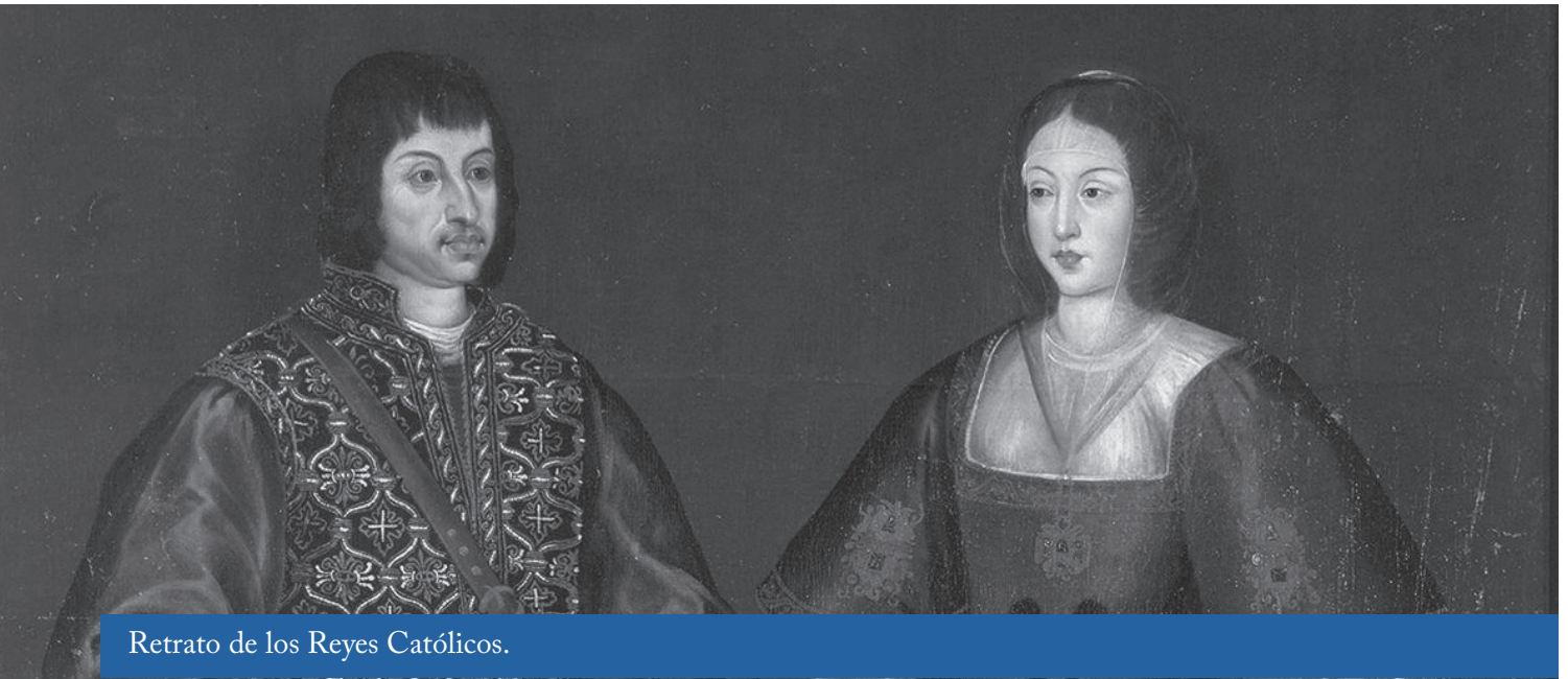
Retrato de los Reyes Católicos.

Al margen de lo idóneo, lo documentado o lo por documentar, el hecho irrefutable es que estamos ante una situación poco favorable para el pueblo español