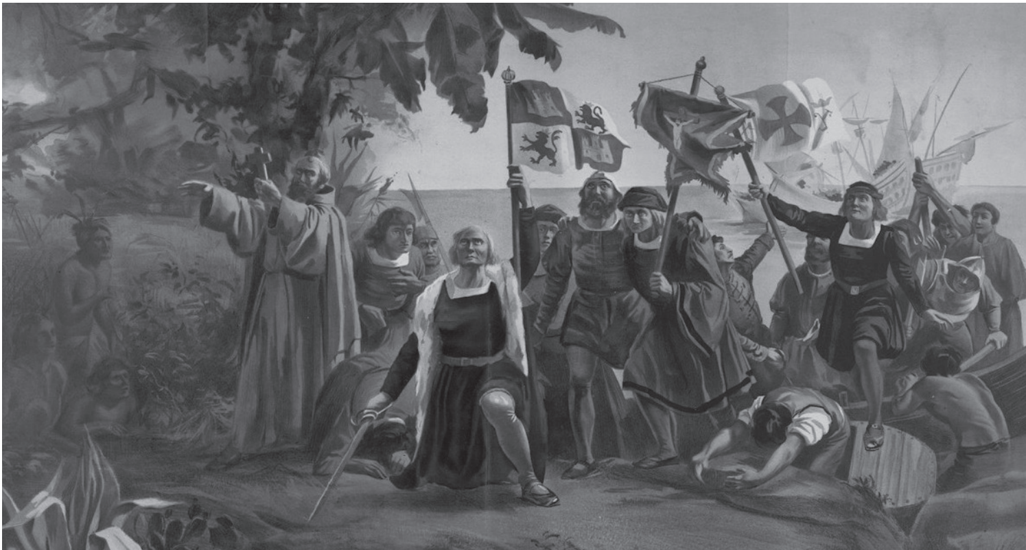
Pintura de 1893 que muestra a Cristobal Colón a su llegada al Nuevo Mundo.

derechos de los indios, de facto los únicos responsables y pioneros en la creación de leyes de protección de los pueblos indígenas. En España, a pesar de lo mucho que se conoce de los Reyes Católicos, poco se ha difundido sobre su labor pionera en la defensa de los derechos humanos, sirva de ejemplo un dato poco estudiado y conocido sobre la última voluntad de la Reina Isabel la Católica, según aparece en su testamento: