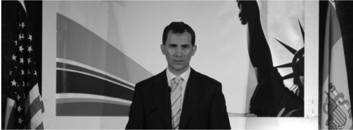
Intervención de SAR el Príncipe de Asturias en el Foro España-Estados Unidos en junio de 2012 (New Jersey)

España-EE.UU. no es ajena la ya tradicional participación y apoyo, incluso en las sesiones de trabajo, de SAR el Príncipe de Asturias. Hemos asistido a lo largo de los últimos años a un gran nivel de asistencia empresarial de las principales compañías españolas y americanas pertenecientes respectivamente al Patronato de la Fundación Consejo España-Estados Unidos y al US-Spain Council. Esta institución hermana es presidida por el senador Bob Menéndez que compatibiliza su cargo con el de Presidente de la muy relevante Comisión de Exteriores del Senado Norteamericano.