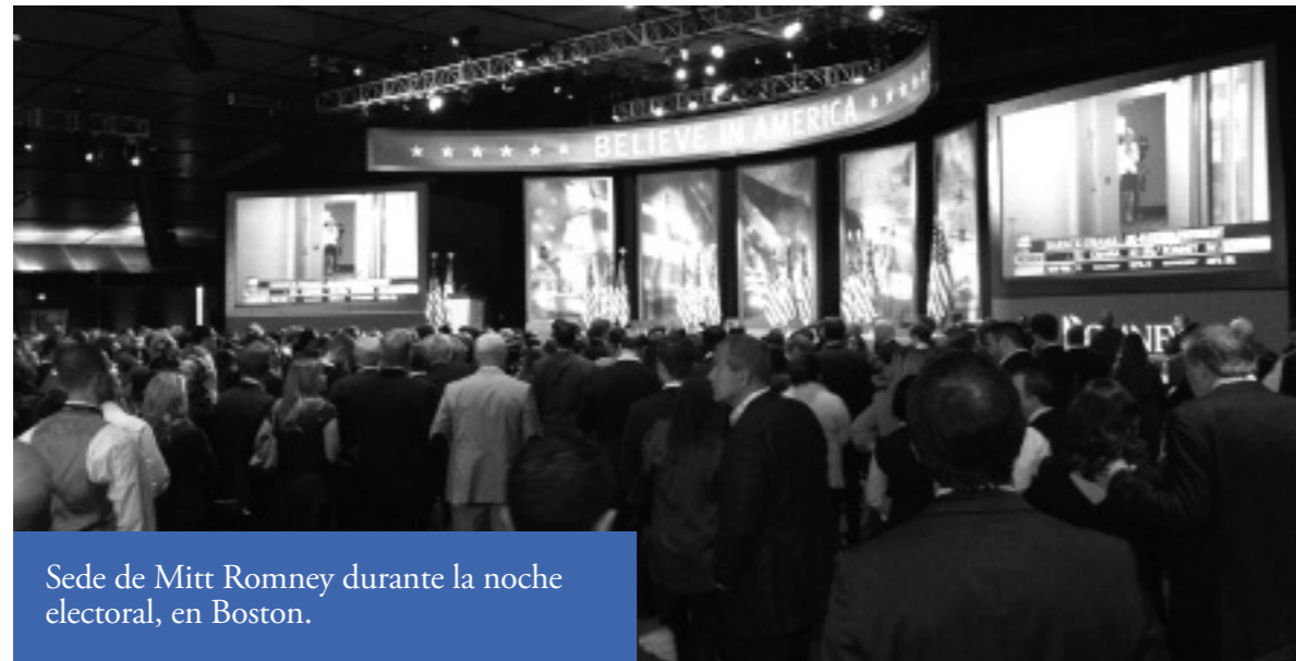
Sede de Mitt Romney durante la noche electoral, en Boston.

En este mismo sentido, el debate respecto al futuro y responsabilidades del Estado en el diseño y ejecución de las políticas públicas -como señalan algunos analistas e indicaba el Obama candidato en algunos actos de campaña- ponía claramente al descubierto significativas