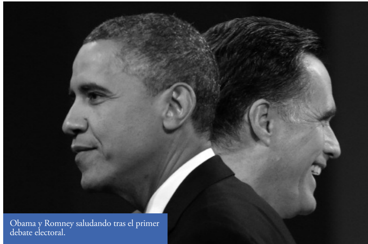
Obama y Romney saludando tras el primer debate electoral.

Por otro lado, el Tea Party no ha logrado romper el corsé de las estructuras partidistas de los sectores tradicionales republicanos para que, sentada a su mesa, la familia conservadora pueda compartir ese Appel Pie símbolo nacional, "tan en riesgo" después del fiasco de una apuesta "tan moderada" como la que ha representado Mitt Romney en esta campaña. Éste empieza a ser el orden del discurso que se escucha, por parte de algunos líderes afines a este grupo, en los días posteriores a la derrota electoral.