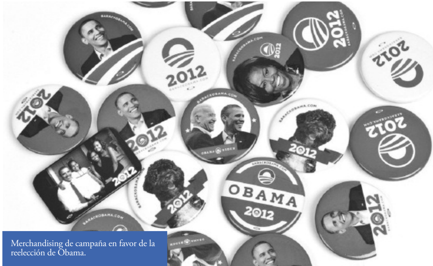
Merchandising de campaña en favor de la reelección de Obama.

Sin embargo, el futuro programa de gobierno destinado a la movilización de estos grupos de electores que le allanaría finalmente el camino a la victoria en ámbitos como la política social, educativa o migratoria, no era posible sin incrementar el gasto y sin "hipotecar el futuro". La idea de gravar las grandes fortunas -como la de Romney- con una reforma financiera y fiscal, que dio un buen juego