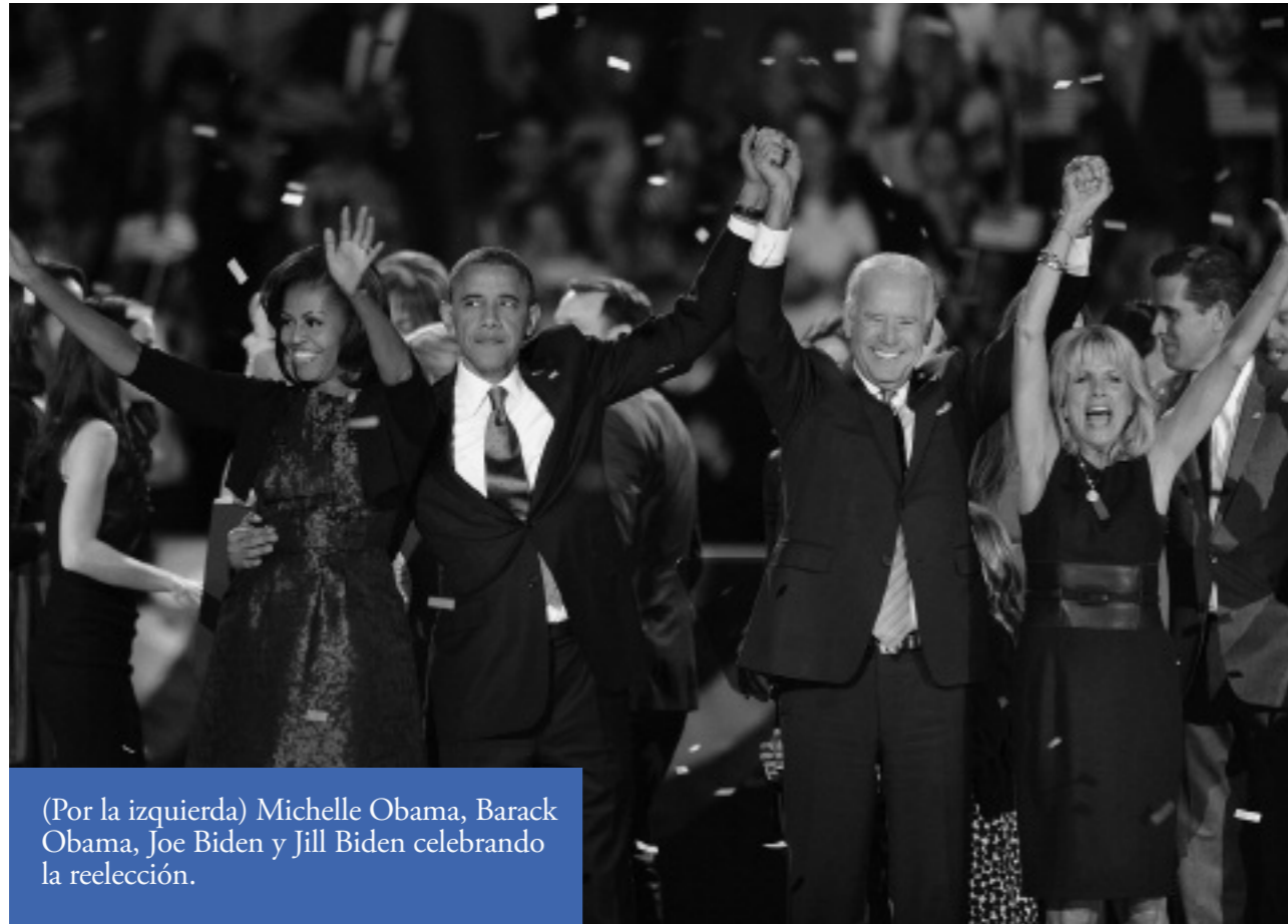
(Por la izquierda) Michelle Obama, Barack Obama, Joe Biden y Jill Biden celebrando la reelección.

de afrontar un nuevo liderazgo económico y financiero, nacional y mundial. No sabemos si una estrategia menos contemporizadora -aún con el riesgo de una cierta crispación- no habría estado más acorde con las expectativas de cambio decidido despertadas, siendo finalmente el balance de la gestión y los logros en este período muy parecidos; probablemente idénticos.